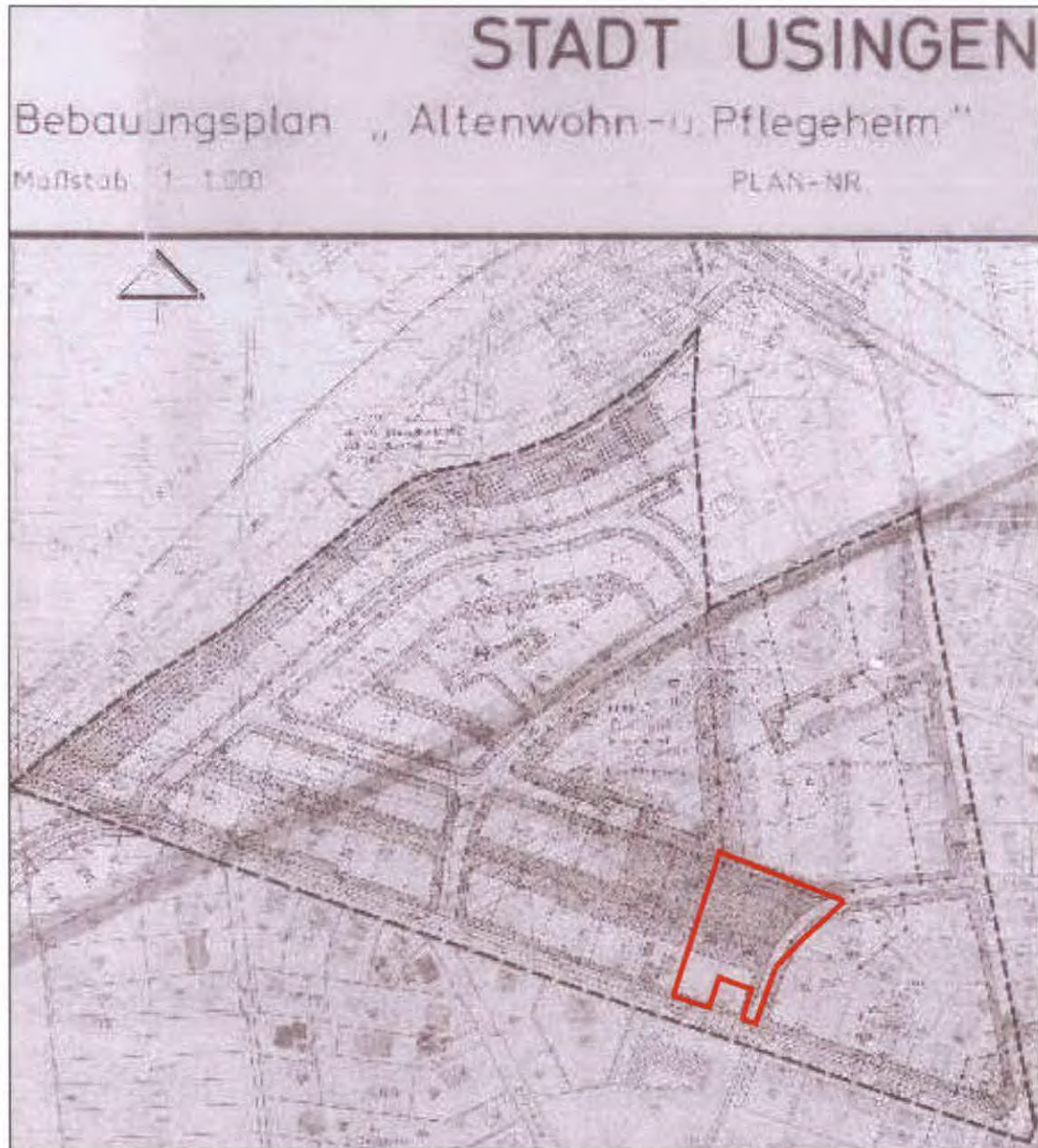
Abbildung 1.: Lage des Plangeltungsbereichs der Änderung innerhalb des geltenden Bebauungsplans o. M.

Die Stadtverordnetenversammlung der Stadt Usingen hat in Ihrer Sitzung am 04.12.2018 die Aufstellung des Bebauungsplans beschlossen.