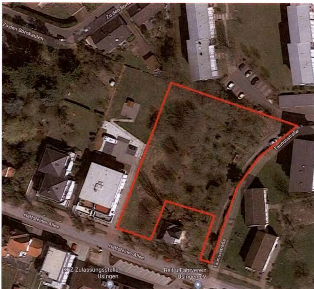
Abbildung 3: Luftbild der nahen Umgebung o. M.