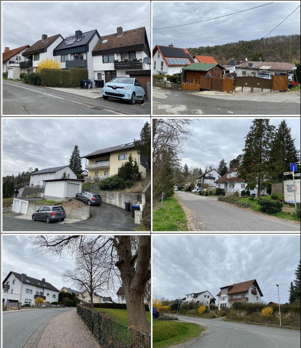
Eigene Aufnahmen (03/2024)