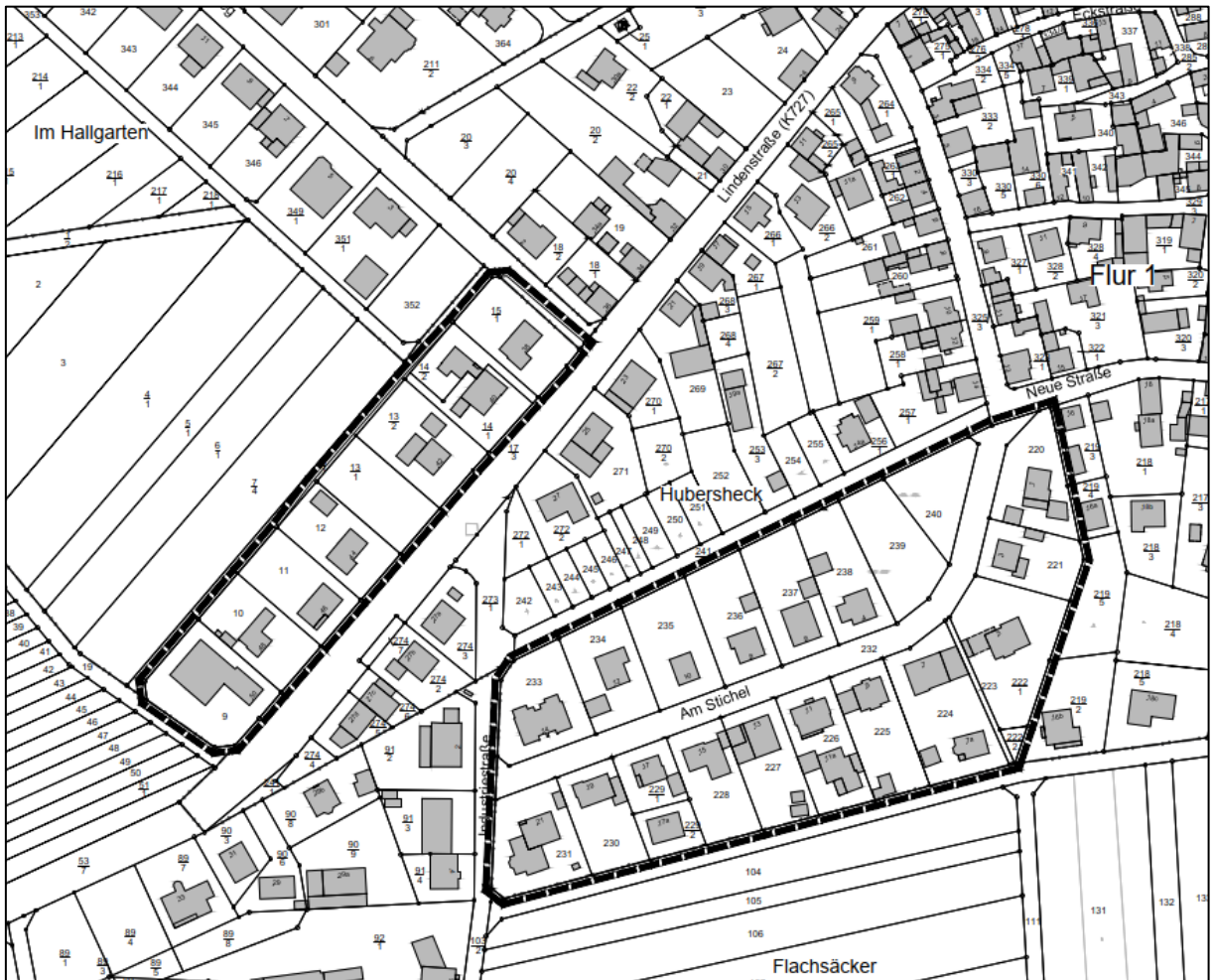
Abbildungen genordet, ohne Maßstab