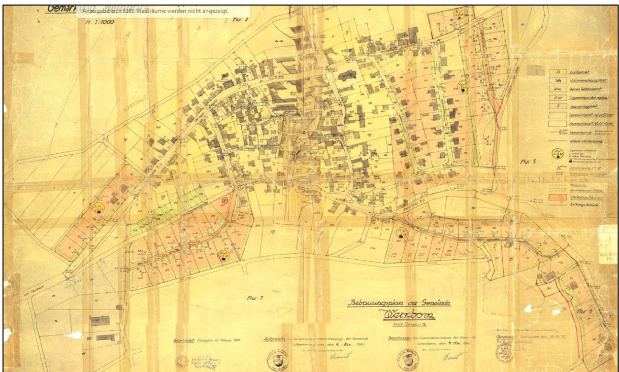
Ausschnitt genordet, ohne Maßstab