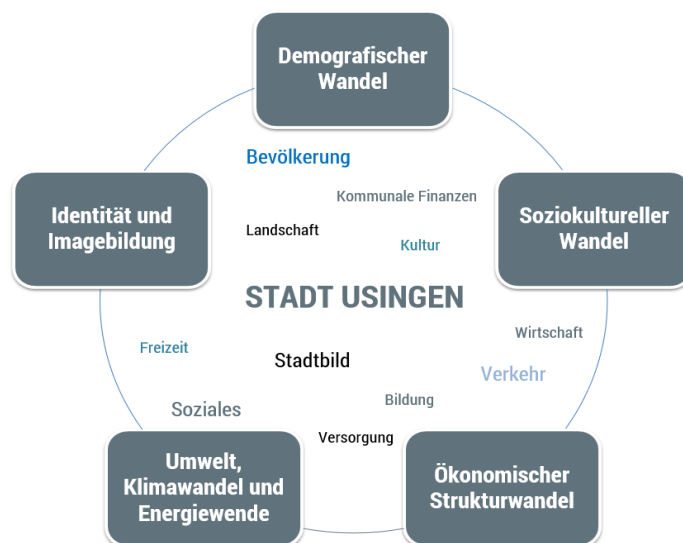
Abbildung 1: Herausforderungen und zukünftige Handlungsschwerpunkte für die Stadtentwicklung, werk-plan 2018

Trotz der Fülle an Standortqualitäten wird auch Usingen sich auf Veränderungen und zukünftige Herausforderungen in allen ihren kommunalen Bereichen einstellen müssen. Die aktuellen Herausforderungen der Stadtentwicklung, wie der demografische Wandel oder der ökonomische Strukturwandel und die damit verbundenen Folgen sowie die steigende Bedeutung des Klimawandels und des Ressourcenschutzes sind komplex und nicht mehr durch sektorale Lösungsansätze zu meistern. Ferner sind diese Aufgabenstellungen auch nicht mehr auf lokaler Betrachtungsebene, sondern nur im gesamtkommunalen Kontext zu lösen.